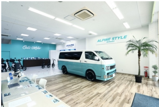
アルパインスタイル沖縄 店舗内観